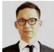
一般財団法人ワンネスグループセレンティパークジャパン名古屋 代表 日本ファミリーインタベンションセンター ディレクター