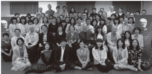
ブラクティショナーコースの皆さんと

ビナイ先生は約30年前から心理カウンセリングを学ばれており、日本でも人気の高いゲシュタルト療法を実践、指導するほか、家族療法にも精通しており、2つを合わせたファミリーコンステレーションワークショップを開催されています。これは依存症回復支援のなかで、普段、私たちがご家族の方をどのように支援し、導けば