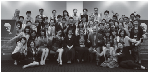
マスターブラクティショナーコースの皆さんと