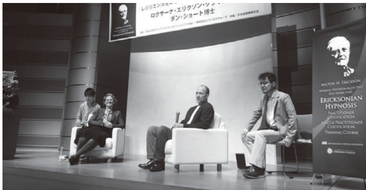
6月8日に行われた講演会より。エリクソン催眠の効果と研究の蓄積に着いて紹介されました。

今回のトレーニングの後、ワンネスグループは米国NLP協会トレーナーズトレーニングのトレーナー認定要件「エリクソン催眠コース受講」の公式指定校として選ばれました。来年もお2人をお招きして、より深いトレーニングを開設させていただくこととすでに決定しています。日本の心理療法の現場において、この素晴らしいメソッドがさらに浸透していくこと、また技術だけでなく、彼らの思いや魂も一緒に伝わっていくよう、これからも努力していきます。参加して下さった皆さま、本当にありがとうございます。また来年、お会いいたしましよ!!