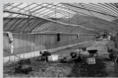
苺を育てるビニールハウスから準備しました。荒れていた土地が見事によみがえりました。