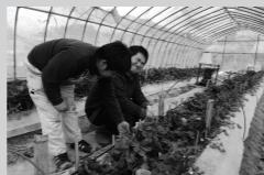
ワンネスグループの多くの仲間力がつなげて、鈴なりに実った苺たち。

大きなプレッシャーを感じる時もあります。でも、力を貸してくださった方たちの大きな力を思い出し「負けるわけにはいかないぞ!」と精一杯やっています。1人の閃きからスタートした苺作りが、今は多くの人を繋げ、その繋がった力が今日も苺を実らせています。